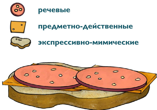
Рис. 1. Бутерброд средств коммуникации

В его основе более ранние средства (взгляд и мимика), а сверху слоями уложены более сложные (жесты и речь). Мы не можем себе представить бутерброд без хлеба — так и коммуникация невозможна без базы: жесты или речь не заменяют ранее освоенные способы общения, а дополняют их. Для успешного общения и во взрослом возрасте важно, чтобы человек не только говорил, но и смотрел на собеседника, чтобы его жесты и выражение лица совпадали с речевым сообщением.