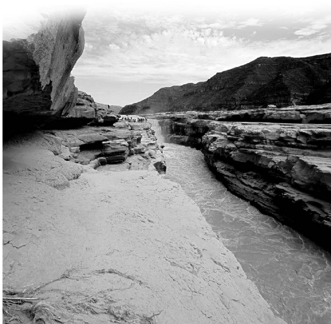
Верхнее течение Хуанхэ

Участок аллювиальной равнины пролегает от ущелья Цинтунся в Нинся до поселка Хэкоу (букв. «Речное устье») в уезде Тогтох во Внутренней Монголии. После того, как Хуанхэ выходит из Цинтунся, она течет на северо-восток вдоль северо-западной границы плато Ордос, а затем поворачивает на восток к Хэкоу. Большую часть территорий, расположенных вдоль этого отрезка, составляют пустыни и пустынные степи. Впадающие реки здесь практически отсутствуют. Русло реки ровное, течение понемногу замедляется, а часть ила и песка оседает на берегах, формируя массивные намывные равнины. Самые известные из них — Иньчуань и Хэтао. Равнины вдоль реки, принимая орошающие воды Хуанхэ, подвергаются паводкам из-за таяния снегов в ее верховьях и другим стихийным бедствиям.