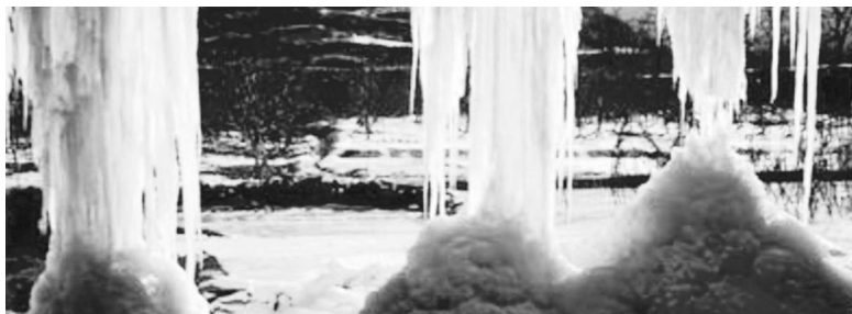
Таяние снегов в низовьях Хуанхэ

Другое стихийное бедствие в нижнем течении Хуанхэ — наводнения из-за ледостава. Их возникновение связано с тем, что нижнее течение проделывает свой путь с юго-запада на северо-восток. Зимой на севере стоят трескучие морозы, поэтому там на реке толстый слой льда образуется раньше. Он блокирует движение воды с юга, где в это время погода более теплая. Однако река продолжает бежать с юго-запада на северо-восток, увеличивая количество воды на замерзшем участке. Дамбы не выдерживают и рушатся, повсюду разливается вода вперемешку со льдом, формируется ледяной поток, угрожающий жизни и имуществу людей на побережье.