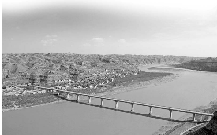
Среднее течение Хуанхэ

Традиционно средним течением Хуанхэ называют участок между поселком Хэкоу в уезде Тогтох во Внутренней Монголии и горной долиной Таохуаюй близ города Чжэнчжоу в провинции Хэнань. Его общая протяженность достигает 1206 километров, а площадь водосборного бассейна — 344 тыс. км 2 , что составляет 45,7% площади реки. Поскольку этот участок располагается в основном на Великой Китайской равнине, общий перепад высот речного русла составляет 890 метров. В него впадает более тридцати больших притоков, возрастающий сток которых вмещает около 42,5% объема реки.