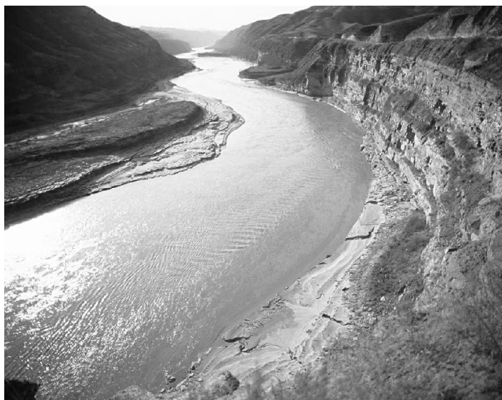
Часть среднего течения Хуанхэ, протекающего через ущелье

В районе среднего течения также располагается самое длинное сплошное ущелье в русле Желтой реки — Цзиньшань-сягу. Оно простирается от Хэкоу до Юймэнькоу. Огромный перепад уровня воды превращает этот участок во второй по величине опорный пункт гидроэнергетики на Хуанхэ. Вниз по ущелью находится знаменитый водопад Хукоу, ширина желоба которого составляет 30–50 метров. В сухой сезон перепад уровня воды достигает почти 18 метров. В период высокой воды речной поток стремительно падает сверху, и брызги разлетаются во все стороны, напоминая мчащийся табун из тысячи коней. Эта и другие особенности пейзажа Хукоу привлекают толпы туристов со всего мира.