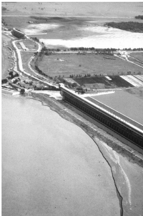
Водораздельный затон в восточной части Хуанхэ на территории Пинху и каменный затон

и уровень воды повышается. Чтобы Хуанхэ не вышла из берегов, люди строят высокие дамбы. О нижнем течении Желтой реки говорят, что это «поток, взгромоздившийся над землей». В окрестностях города Кайфэн в провинции Хэнань высота русла находится практически наравне с местным символом — Кайфэнской железной башней, возвышающейся на 58 метров. Каким бы великолепным не было это зрелище, оно таит в себе большую опасность. Хотя Хуанхэ заперта за стенами больших плотин, «но ее воды все так же свободны» 4 ; образует естественную границу между бассейнами рек Хайхэ и Хуайхэ.