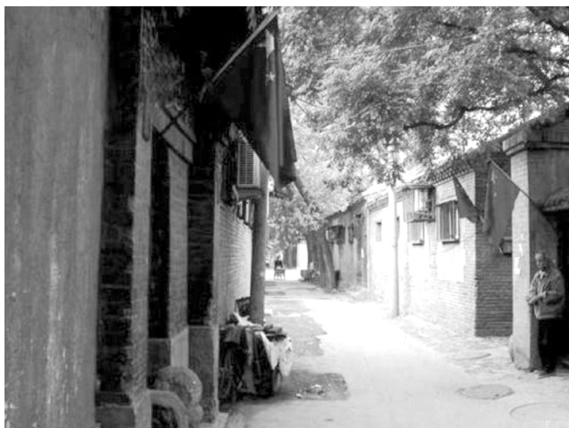
Один из многочисленных пекинских хутунов – Цзюваньхутун

«Таз» — образованы от пекинских диалектных и просторечных слов. Названия некоторых других хутунов должны притягивать удачу: «Радость», «Несущий счастье», «Благополучие», «Долголетие».