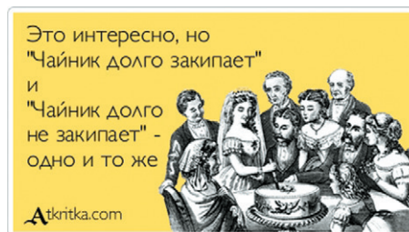
Рис. 1. Кстати, так называемые «Аткрытки» показывают феноменальную живучесть — такой формат контента уже несколько лет хорошо воспринимается аудиторией

Когда я пишу «по возможности оригинальная», это не обязательно означает «нигде, никогда и никем не опубликованная ранее». Все далеко не так. «Оригинальная» в данном случае — это скорее «вписанная в ваш