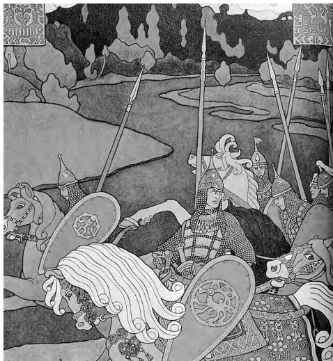
И.Я. Билибин. «Дружина Вольги»

Задание 1. «В образе Вольги соединены черты эпического героя глубокой древности, эпохи первобытно-общинного строя с чертами героя государственного периода Руси. Он, с одной стороны, великий охотник и колдун, умеющий покорять себе природу, животных, но, с другой стороны, Вольга – князь-богатырь, возглавляющий дружину. Двойственность, сочетание древнего и более позднего пронизывает весь образ». (Ю.И. Юдин)