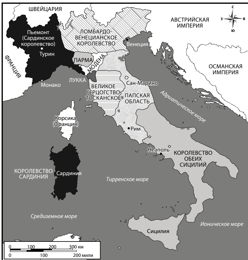
Карта 2. Детальная карта Италии.