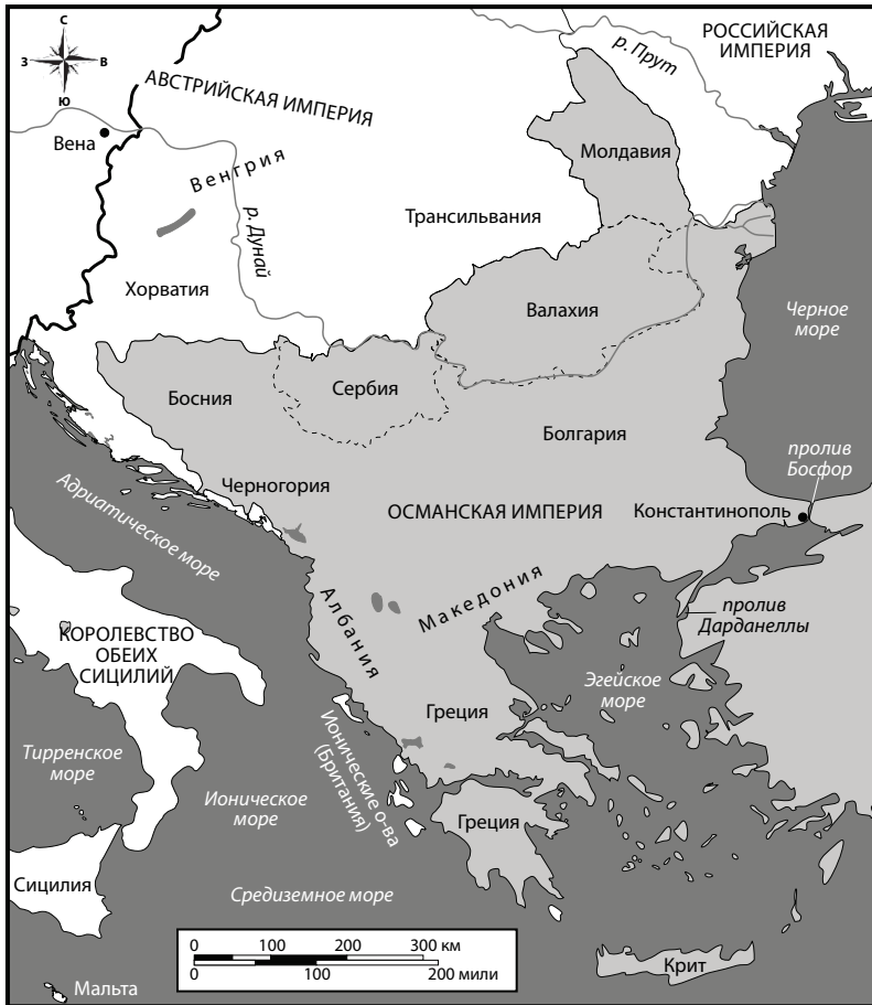
Карта 3. Детальная карта Балкан.