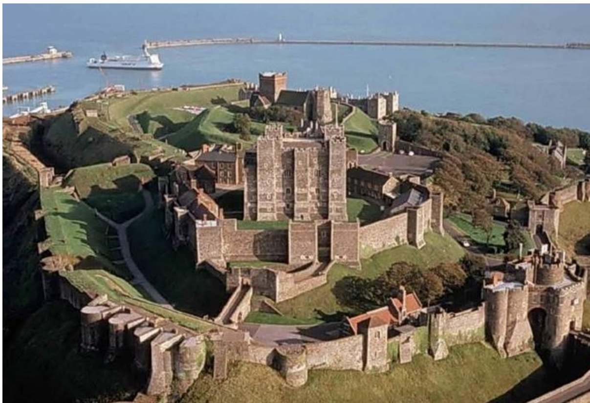
Рис. 3. Замок Дувр в Англии

Одновременно происходило и усиление влияния религии — экономическая независимость религиозного сообщества способствовала мощному строительству культовых зданий.