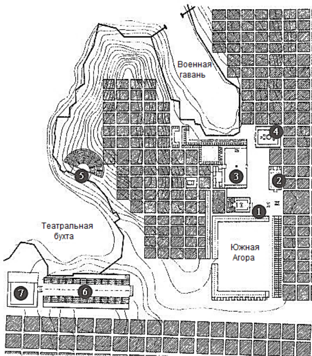
Рис. 1. Центральный ансамбль г. Милета:

1 — бульварий; 2, 7 — гимнасий; 3 — Северная агора;