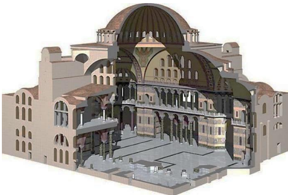
Рис. 4. Храм Святой Софии в г. Константинополе: аксонометрия в разрезе

В Византии молодая христианская религия ставила зодчим новые задачи — создание уникального в своем роде внутреннего пространства храма, где верующие могли бы отвлечься от мирской суеты; кроме того, размеры храма при единобожии должны были значительно превосходить святилища языческих богов и быть способными вмещать тысячные толпы верующих. К наследию Рима — базилике и центрическому купольному зданию — добавились новые типы храмов: купольные базилики и крестово-купольные храмы. Полусферические купола через систему парусов и подпружных арок опирались на прямоугольную в плане систему опор (храм Святой Софии в г. Константинополе) (рис. 4).