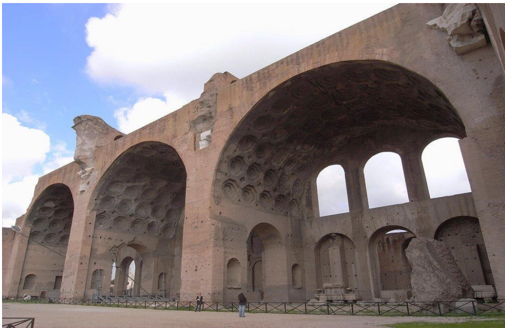
Рис. 2. Базилика Максенция — Константина в Риме

Период Средневековья , с его феодальным общественно-экономическим строем, отмечен вынужденным широким распространением замковых комплексов с фортификационными сооружениями различной типологии (рис. 3).