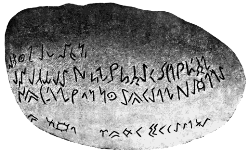
Рунический памятник Древнего Алтая