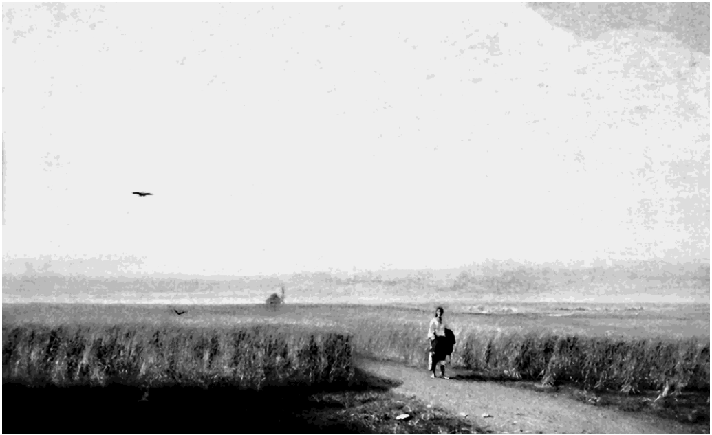
Степь. Нива. А. И. Куинджи

Были многозначительные письма: «Прочитал ваши книги, душой принял их. 30 лет я прожил в степной Украине, много времени проводил в степи, а вот теперь живу в Ярославле, центре Руси, и который год не нахожу себе места. Не понимал, что мне не хватает простора и запаха полыни». И такое было, из Баку: «Прочитав ваши книги, я открыл мир заново. Книги поставили точку моим сомнениям и страданиям. Вы написали правдивую историю тюрков. Своим друзьям я теперь дарю ваши книги, считаю, что дорожке подарка нет».