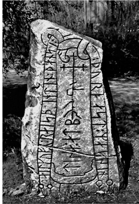
Рунический памятник близ Стокгольма. Швеция

К сожалению, российская историография не отличается гибкостью, со дня своего рождения плетется в хвосте западной науки. Она никогда не имела ни лица, ни характера, соглашалась с любыми иезуитскими «новациями». Согласилась со славянским началом России, хотя известно, что Киев заложен в V веке и не славянами, которых как народа и даже этнической общности тогда еще не существовало в природе.