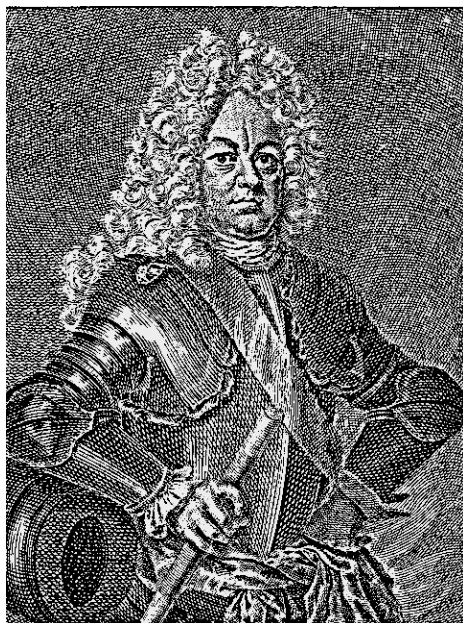
Яков Брюс. Его слову не перечил даже царь

а логика и факты пришли в вопиющее противоречие. Иезуиты посеяли на страницах наших книг незнание, оно и не позволяет отделить зерна от плевел. Так в обществе укреплялось беспamięтство.