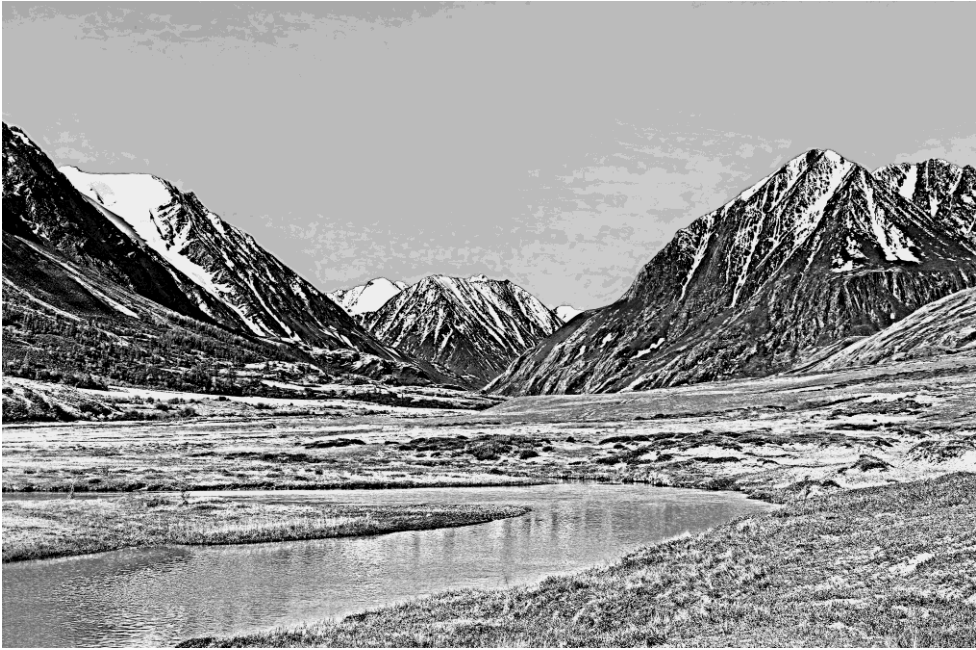
Алтай — «колыбель» российской истории

Если тюрки оседлали коня, изобрели плуг, значит, жизнь их протекала иначе, чем у иных народов планеты, и мне захотелось показать это. То есть показать те тончайшие нити, которыми вышиваются узоры жизни. У каждого народа эти узоры свои, они — как метка, поэтому у каждого народа своя культура, своя щедрость, свой достаток.