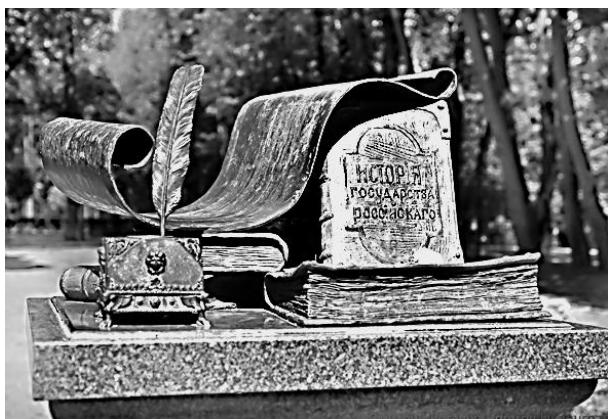
Памятник Карамзину и первым семи томам его «Истории». Усадьба Остафьево. Московская область

Под руководством Брюса первый русский историк Василий Татищев в XVIII веке создал фундаментальный труд «История Российская с самых древнейших времен», где воплотилась в плоть и кровь точка зрения Рима,