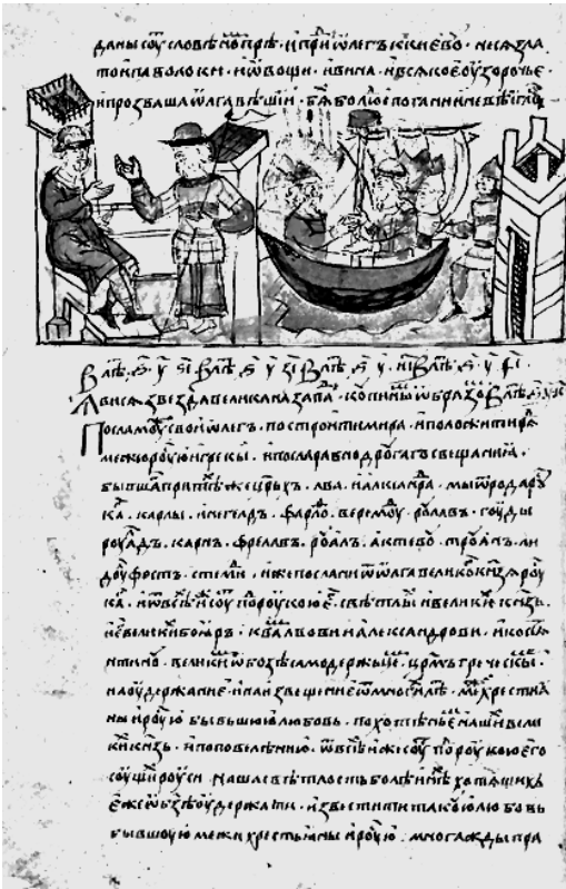
Текст русско-византийского договора, заключенного в 911 году. Радзивилловская летопись. Конец XV в.

Елизавету — за норвежского, дочь Анастасию — за венгерского, дочь Анна стала женой французского короля Генриха I... Все католики, точнее, прихожане Западной церкви. Почему? Ведь межконфессиональные браки запрещались под страхом смерти. Особенно в православии.