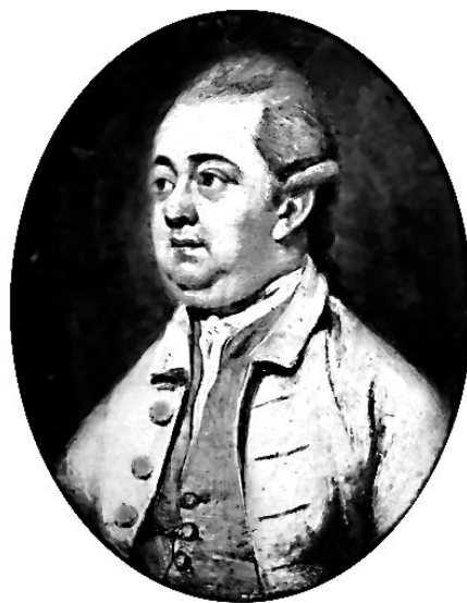
Эдуард Гиббон (1737–1794). Несравненный знаток Средневековья

— Откуда такая самоуверенность, а также средства, возможности?