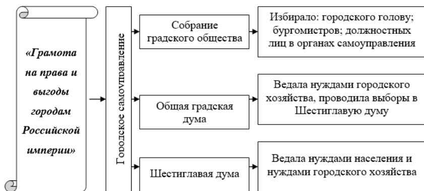
Схема 4. Реформа городского управления Екатерины II

В дальнейшем земская реформа была дополнена реформой городского самоуправления, которая в целом строилась на тех же принципах, что и земская, поэтому для её подготовки использовался практический первый опыт работы земских институтов.