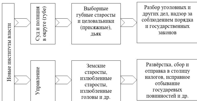
Схема 1. Реформа местных институтов власти Ивана IV

Политика по оживлению демократических начал русской жизни, предпринятая Иваном Грозным, очень скоро сослужила хорошую службу. В период Смутного времени городские (посадские) и крестьянские (волостные) общины стали последним рубежом в борьбе за национальную независимость. Смута XVII в. отличалась от многих других кризисов, потрясавших прежде нашу страну своей системностью. Одним из важнейших её компонентов была десакрализация власти, потеря доверия к ней со стороны народа. Государство в России – больше, чем просто государство. Это возможность нации выжить, сохраниться. Это тот защитный купол, который веками выстраивался русскими, окруженными суровой природой и жадными соседями. Разложение государства привело к угрозе полного исчезновения и порабощение русского народа. Лишь когда, благодаря первому и второму народному ополчению, сам народ смог себя консолидировать, воссоздав государство снизу, вновь обозначилась перспектива национального возрождения. В городах и сёлах бурлила политическая жизнь, как в Киевский период собирались собрания всех свободных жителей округи. На короткий промежуток времени