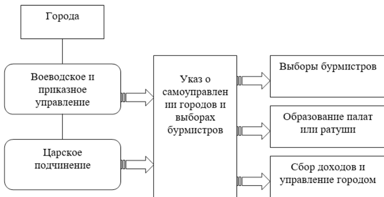
Схема 3. Реформа городского управления Петра I

и общественная роль демократических институтов были резко ограничены, что было связано не только с эволюцией государственного строя, но и с необходимостью мобилизации ресурсов всей страны на победу в Северной войне. Однако и в это время центральной властью предпринимались целенаправленные попытки использовать созидательный потенциал шедшей из глубин нашего народа инициативы. Ряд шагов в направлении закрепления основных прав демократических органов самоуправления был сделан величайшим царём-реформатором Петром I. Помимо всего прочего, Пётр внёс, например, немало нового в систему организации местной власти в городах. Примечательно, что реформы органов муниципального управления были начаты им даже раньше, чем преобразования центрального государственного аппарата. Их старт можно отнести к январю 1699 г., когда появляется Указ о самоуправлении городов и выборах бурмистров. Предпринятые в ходе реформы меры смогли вывести города из-под воеводского и приказного управления и передать их в управление непосредственно царю. За образец дальнейших реформ Петром была взята система организации муниципального самоуправления ряда европейских государств, в частности Швеции. В 1721 г. на основе Ревельского (таллиннского) устава был создан орган городского самоуправления в новой русской столице Санкт-Петербурге – т. н. Главный магистрат (см. Схему 3).