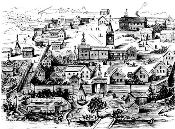
Выговская пустынь. Гравюра XVIII века

Традиции дораскольной архитектуры получили продолжение, в частности, в храмах Выговского и Лексинского общежитеств. Об этом красноречиво свидетельствуют старинные гравюры и рисованные лубки, а также редкие фотографии конца XIX — начала XX веков. Архитектурный облик Выговского общежитества сложился уже к началу XVIII века. В центре стояла соборная часовня Богоявления Господня (она была построена в 1710-е годы) — большая постройка, состоявшая из двусветной моленной, обширной трапезной и сеней. Трапезная и сени имели единую кровлю и по два окна, располагавшихся на одном уровне с нижними окнами моленной. Моленная («певческая») имела