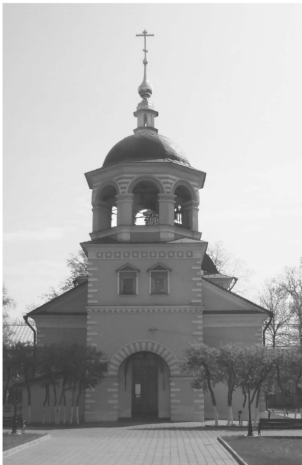
Крестовоздвиженская часовня на Преображенском кладбище в Москве