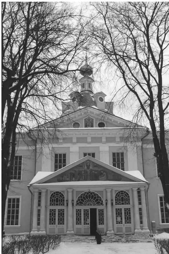
Покровский собор Рогожского кладбища в Москве