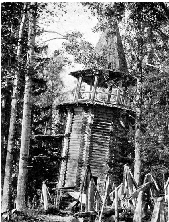
Остатки Выговской пустыни в начале XX века