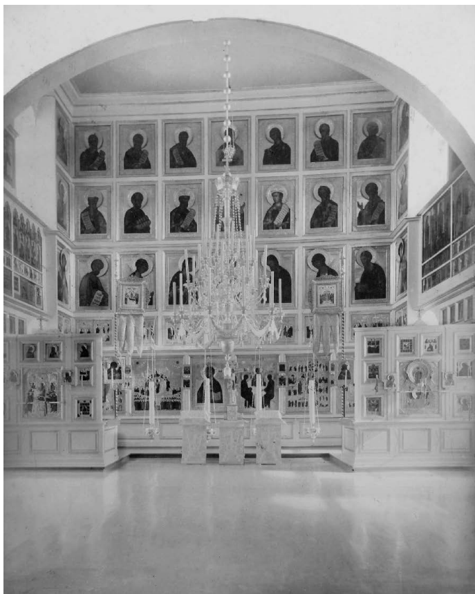
Иконостас Крестовоздвиженской часовни Преображенского кладбища в Москве