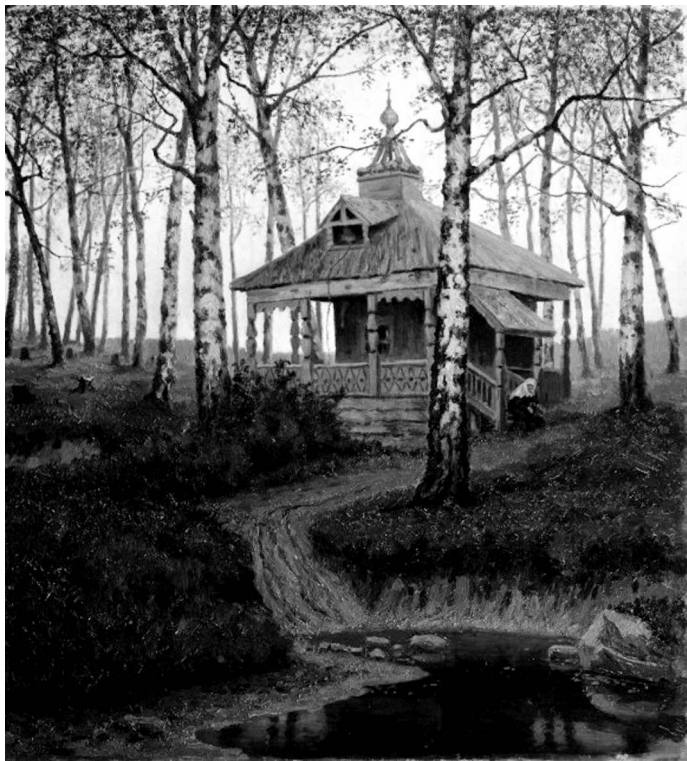
Скит. Художник Е. Е. Волков